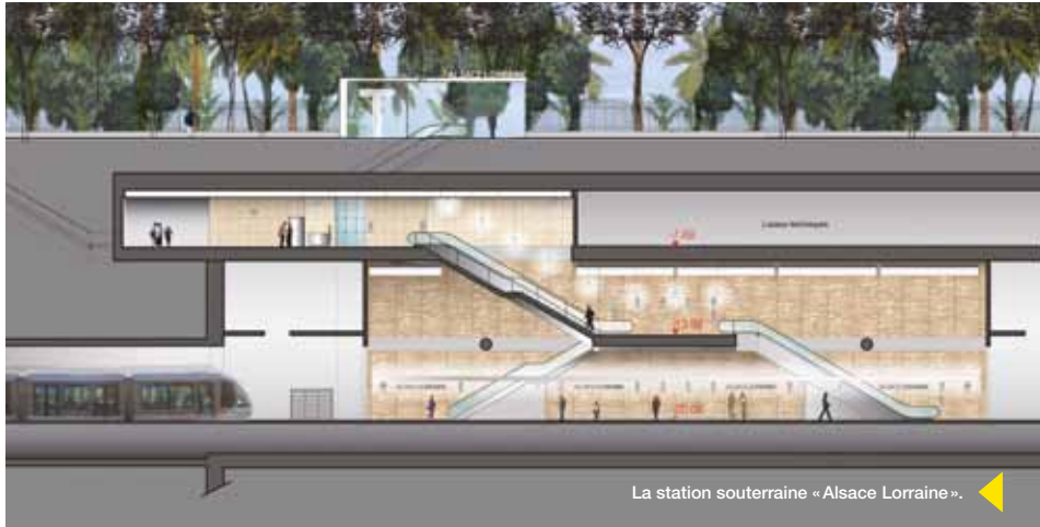
La station souterraine « Alsace Lorraine ».