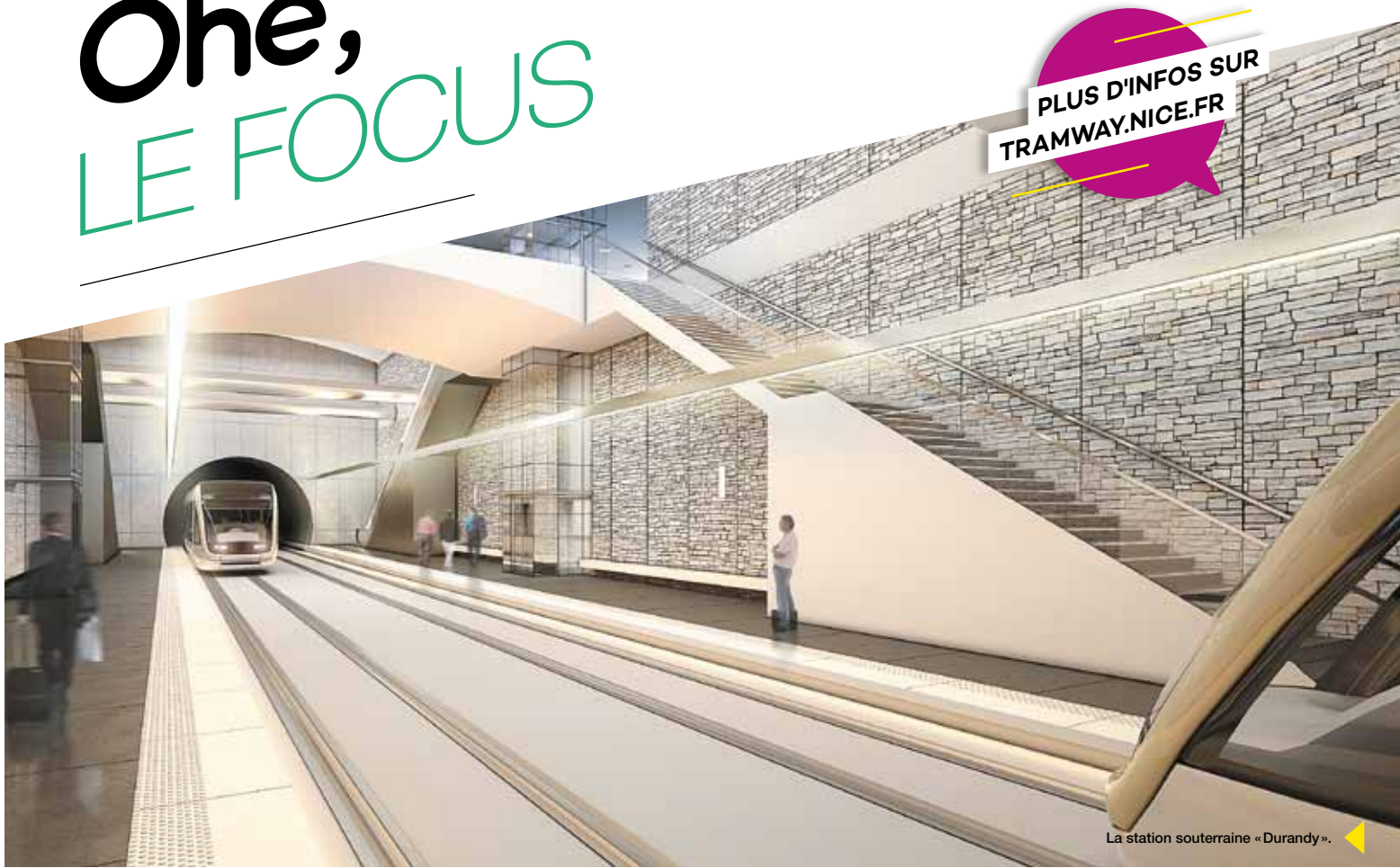
La station souterraine « Durandy ».