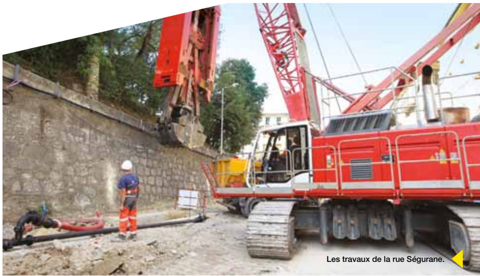
Les travaux de la rue Ségurane.